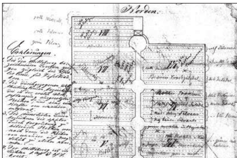
Detail situačného plánu keliovského vinohradu